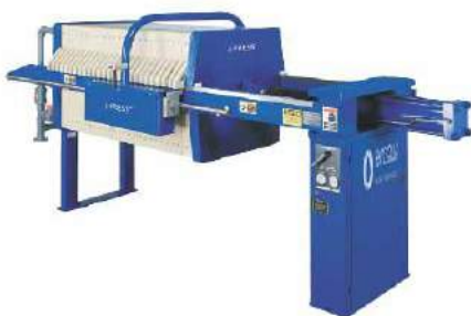
Separación de sólidos de valor