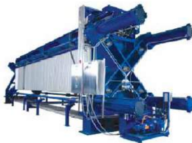
Filtros prensa, refacciones, servicios, mantenimiento